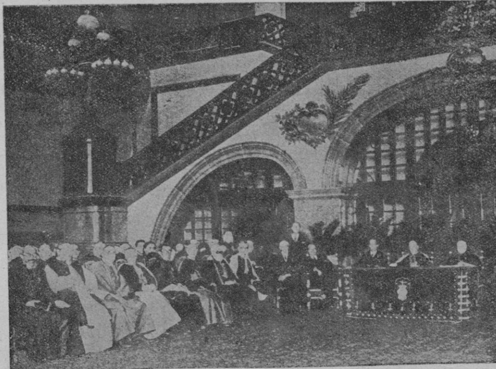
Presidencia del Congreso Misional inaugurado en Barcelona, con la asistencia de varios señores Prelados

El "Constancia" tiró también un "penalty". X.