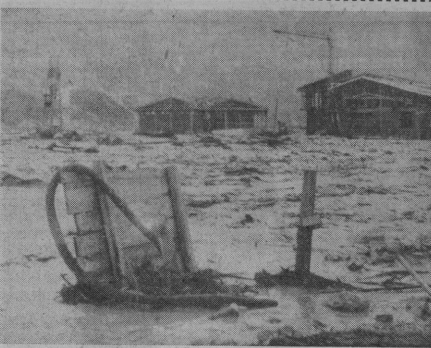
Belluno (Italia).—El nuevo edificio en construcción en Longarone, que fue completamente destruido por el desastre del pantano de Vajont, en mil novecientos sesenta y tres, sufrió grandes daños a consecuencia del desbordamiento del río Piave por las persistentes lluvias.

Hasta ahora los ratones han devorado mil trescientas hectáreas de cosechas. Los campesinos luchan con todos los medios de que disponen para desviar esta plaga de sus campos, pero todo es inútil. Se han realizado en último extremo zanjas a las que se ha vertido petróleo y luego prendido fuego; no obstante, han fracasado los intentos de bloquear la invasión y los ratones continúan su avance.—Efe-Reuters.