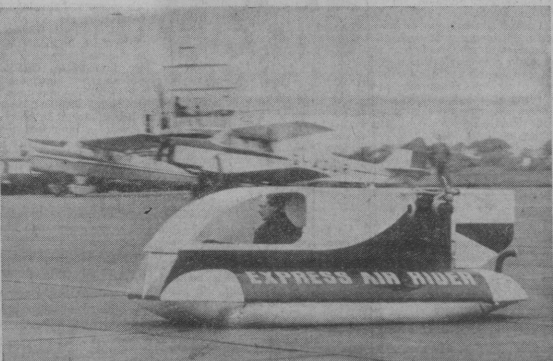
Biggin Hill (Kent).—He aquí el primer aero flotador, o "air rider" construido por un aficionado inglés, durante unas pruebas realizadas en el aeropuerto de la Batalla de Inglaterra, en Biggin Hill. A pesar de un viento de 25 nudos, las pruebas fueron realizadas con éxito. El aparato va provisto de tres motores de motocicleta.

«Los precios de referencia» de las naranjas para la campaña 1966/67 han sido fijados por la comisión permanente de la C. E. E. a un nivel igual o ligeramente inferior a los del año pasado, tal como se esperaba en los círculos económicos de la capital.—Efe.