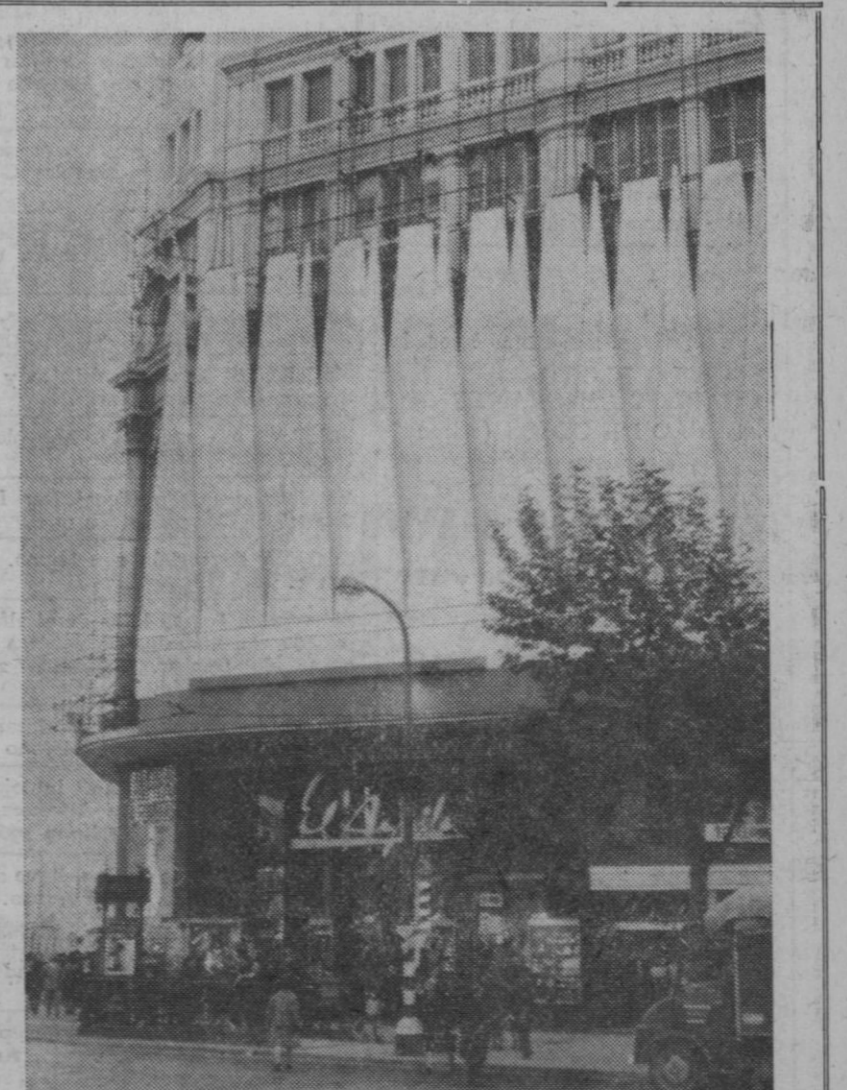
Barcelona.—Ya han comenzado a montar en las calles barcelonesas los primeros adornos que tradicionalmente engalanan la ciudad durante Navidad, Año Nuevo y Reyes.

Brooks también declaró que Houghton dirigió el entrenamiento de armas automáticas.—Efe-Reuter.