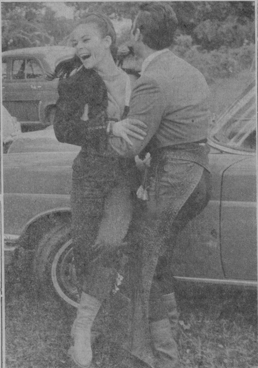
Beatriz de Saboya, hija del rey Humberto de Italia, y Victoriano Valencia. ¿Romance entre una princesa y un torero?

Aunque su empleo de funcionaria de la Unesco, a la que pertenece desde hace algún tiempo—no hay que olvidar que Beatriz domina casi todos los idiomas modernos—, le impide fijar su definitiva residencia en España, ella ha encontrado la manera de compartir su trabajo y sus sentimientos, pasando en Madrid largas temporadas, todas aquellas que por vacaciones o permisos se lo permitan. Aunque no lo necesitaba—tal es el número de grandes amigos que tiene entre familias españolas—, Beatriz prefirió tener su casa, su piso, su pequeño e íntimo hogar, en un apartamento de la avenida del Generalísimo, donde se siente feliz como no se ha sentido en ningún otro sitio, según expresión de ella. También desde Madrid se siente más cerca de Cascaes, el pequeño pueblecito de pescadores donde su padre vive un triste y tranquilo exilio, y donde ella pasó casi toda su infancia.