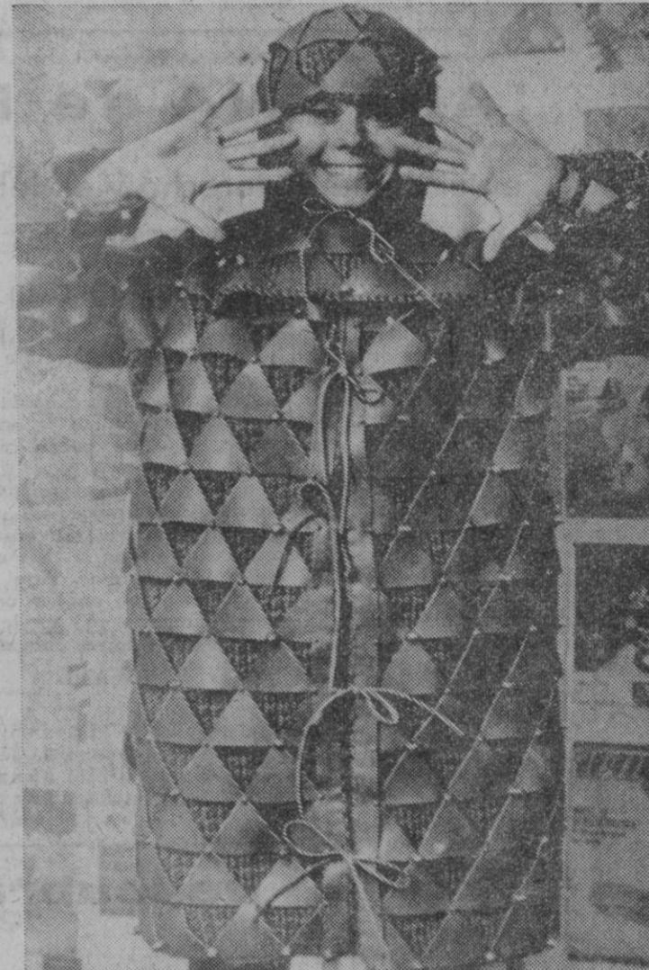
Modelo de Rabanne, formando una malla a base de triángulos de cuero, unidos por clavos.