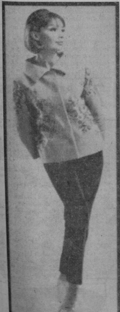
Conjunto de "aprés-ski" en terciopelo de algodón. Chaqueta clara y pantalón oscuro

su feudo londinense de Carnaby Street impuso una moda «distinta» en su país puede provocar, aun sin quererlo, una crisis en Francia. En efecto, la moda inglesa o, por decirlo de otro modo, el estilo Mary Quant, ha desembarcado en el continente y amenaza el cetro de la costura francesa que con tanto afán y tantos medios París ha retenido durante décadas.