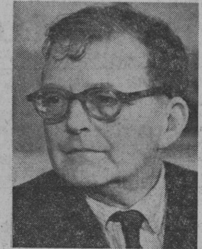
Dimtri Schostakovich, célebre compositor ruso, que acaba de cumplir los sesenta años de edad.

Desarrollará principales actuaciones: la "Operación Juan de la Cosa" y la "Operación San Salvador", y su primer acto público consistirá en el ofrecimiento de una estatua de Isabel la Católica a la ciudad de San Luis (Missouri) encargada por varios generosos donantes.