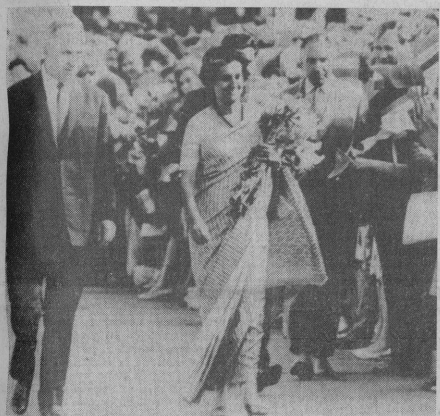
Moscú.—Indira Gandhi, primer ministro de la India, es recibida en Moscú por una multitud entusiasta. A su izquierda, el primer ministro soviético Alexei Kosyguin.