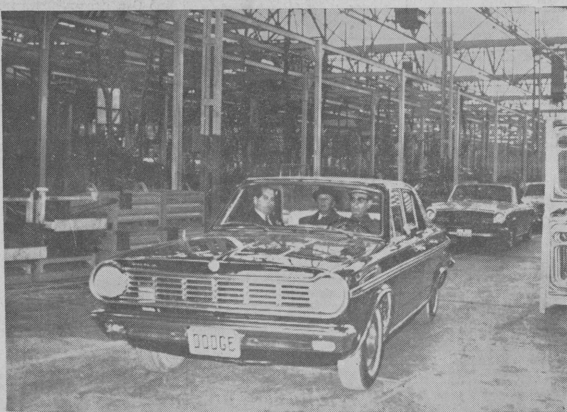
Su Excelencia el Jefe del Estado durante la visita a las factorías "Barreiros", situadas en las cercanías de Madrid. Después de interesarse por el funcionamiento de las mismas, visitó la planta de fabricación de vehículos "Simca", cuya fabricación comenzará ahora en España. Vemos en la foto un momento de la visita, en la que estuvo acompañado por varios ministros del Gobierno. En el coche van con él, el señor Barreiros y el ministro de Industria.

La tuberculosis es siempre una enfermedad transmitida; por ello donde aparece un tuberculoso debe pensarse siempre quién fue el que produjo el contagio