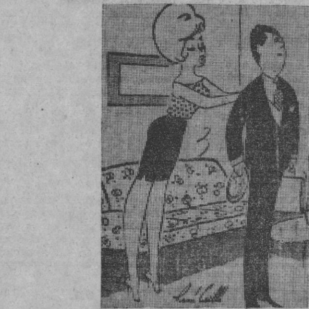
—Creo que necesita un poco de ayuda para decidirse a pedir aumento de sueldo...

MEJOR QUE LA REALIDAD Distribuidor exclusivo CASA SOLERA