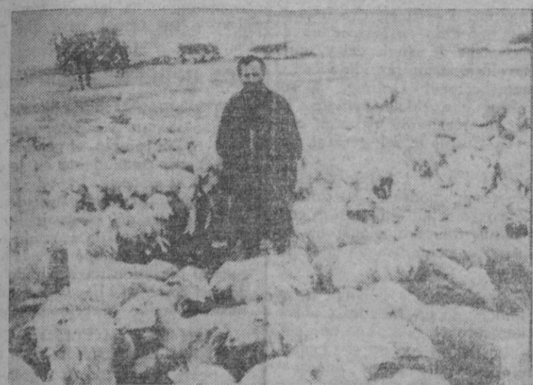
Estampa lípica en nuestros campos. El pastor, el diligente y sufrido pastor, cuida las ovejas puestas bajo su custodia. Pero los tiempos, que no en vano cambian, han originado ahora una acusada falta de pastores en la ganadería. Y escenas como ésta se ven ya con menos frecuencia

La atracción auténtica del mercado la constituyó el ganado porcino, alrededor del cual hay una inusitada animación. El precio siguió establecido en las 48 pesetas, también con tendencia al alza.