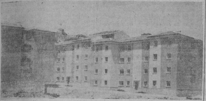
Aspecto de uno de los bloques de las viviendas inauguradas ayer en Cuellar.

que en Cuellar, en Segovia y en todos los pueblos de la provincia, cada trabajador, cada empleado tenga una casa en la que se sienta agusto y como todos sabéis, esta necesidad, este problema no está solucionado. La escasez de viviendas—sigue diciendo el señor Charro de Murga—no fuezo de la Organización Sindical fuerza de la Organización Sindical a las entidades y a particulares para problema de ámbito superior, y por ello me atrevo a hacer un llamamiento a las entidades y a particulares para que se constituyan en promotores. Quiero agradecer públicamente las facilidades que nos han brindado la corporación municipal de Cuellar, cuyo alcalde y jefe local del Movimiento así como los restantes miembros del Ayuntamiento no han regateado esfuerzos para ayudar a la Organización Sindical, especialmente en la cesión de terrenos. Igualmente a los técnicos de la Obra Sindical del Hogar por su competencia y celo en la redacción de proyectos y vigilancia de las obras, y a los contratistas por el esmero en la ejecución de lo proyectado. A los beneficiarios, en primer lugar, mi felicitación porque desde hoy viviréis en las habitaciones a que tenéis derecho y en las que espero paséis muchas horas de felicidad, y después, recomendaros encarecidamente, que miréis las casas desde el primer momento como algo vuestro.