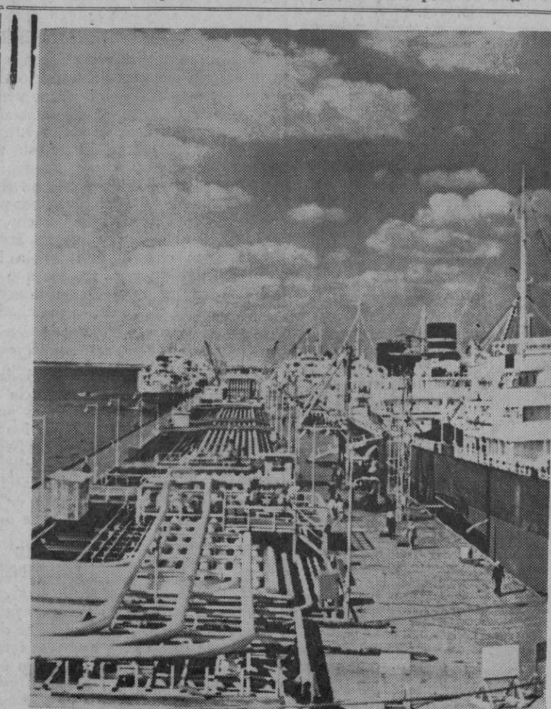
El final de los oleoductos que conducen al puerto de Kina Al Ahmadi (Kuwait), uno de los puertos petrolíficos mayores del mundo. La «Kuwait National Petroleum Company» ha propuesto al Gobierno de su país su asociación con el grupo petrolífico español «Hispanoil» para investigar y explotar la mitad del territorio nacional.

Y este es el plan de veraneo de todos y cada uno de los ministros del Gobierno español, que demuestra la exactitud de aquella idea orteguiana que decía, en síntesis que «cuanto más elevado es el puesto, más duro es el servicio».—Cifra.