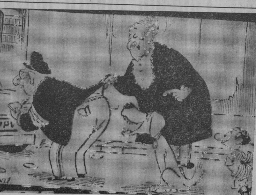
—Vamos "chuchin"... date un capricho