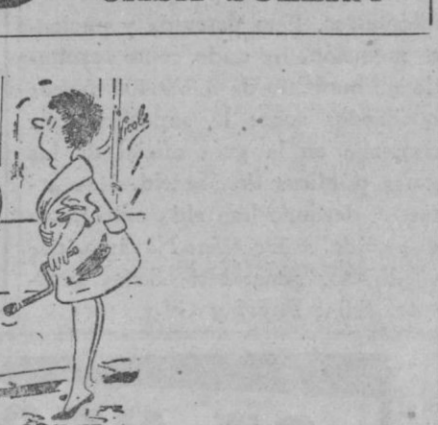
¿Ha visto pasar un coche sin nadie dentro...?

MEJOR QUE LA REALIDAD Distribuidor exclusivo CASA SOLERA