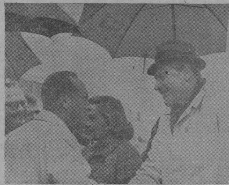
El gobernador de Nueva York, Nelson Rockefeller, en el momento de llegar al aeropuerto madrileño de Barajas, acompañado de su esposa, y donde fue recibido por representantes de su país.

El prestigio de las galletas vizcainas ha traspasado las fronteras nacionales y actualmente son solicitadas por agentes importadores de numerosos países de todos los continentes.—Efe.