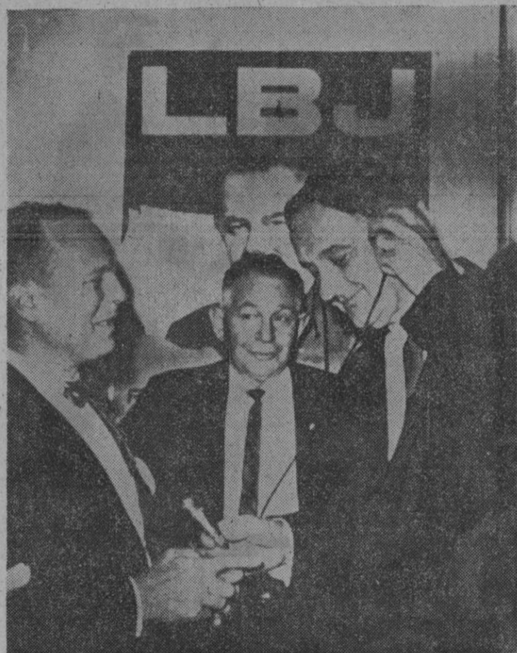
Lyndon B. Johnson, triunfante en las elecciones norteamericanas, sometido al interrogatorio de la prensa, por teléfono, cuando se hallaba en Austin (Texas), e inmediatamente después de su aplastante victoria electoral frente a Goldwater.