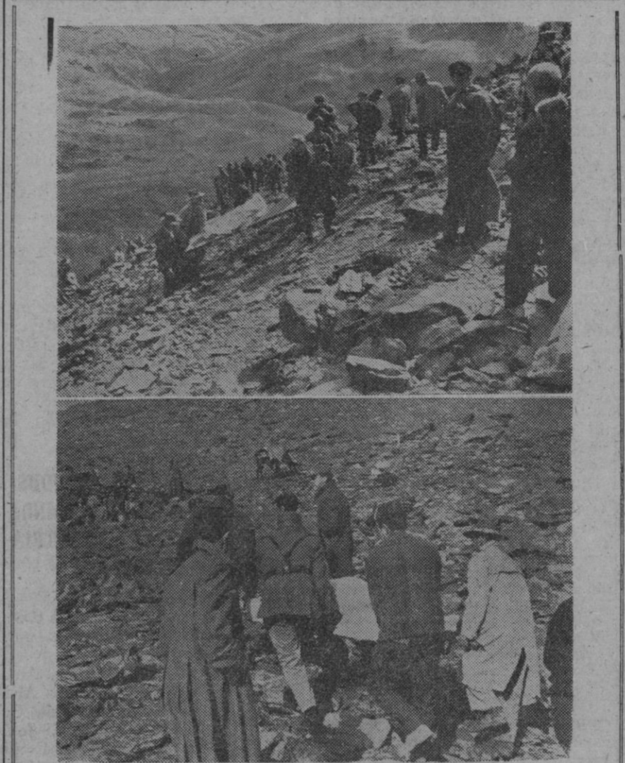
Voluntarios y guardias civiles trasladan pensosamente los restos de las ochenta víctimas (veinticuatro de ellas niños), del avión «DC-6» de la U. T. A., estrellado contra el pico Cotlerón (Sierra Nevada, Granada), al estallar en el aire cuando realizaba la travesía Marsella-Port Etienne. El traslado fue muy penoso, ya que el lugar es casi inaccesible y el de mayor altura de España (más de tres mil metros).

«EL CORDOBÉS», A PARIS Madrid, 8.—Con dirección a París ha marchado en avión el torero «El Cordobés».—Cifra.