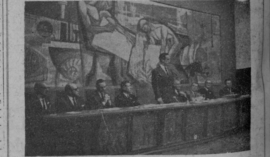
Madrid.—Bajo la presidencia del ministro de Industria, don Gregorio López Bravo, se inauguró, en el Instituto de Ingenieros Civiles, la reunión de verano en España, de The Royal Institution Of Naval Architects. En la foto, un momento del acto.

La redacción de los guiones didácticos correspondientes a los temas de estos cursos estará a cargo de cátedráticos numerarios pertenecientes a diferentes Institutos Nacionales de Enseñanza media, designados por el Centro Nacional, con el asesoramiento de la Escuela de Formación del Profesorado de Enseñanza Media y del Centro de Orientación Didáctica.