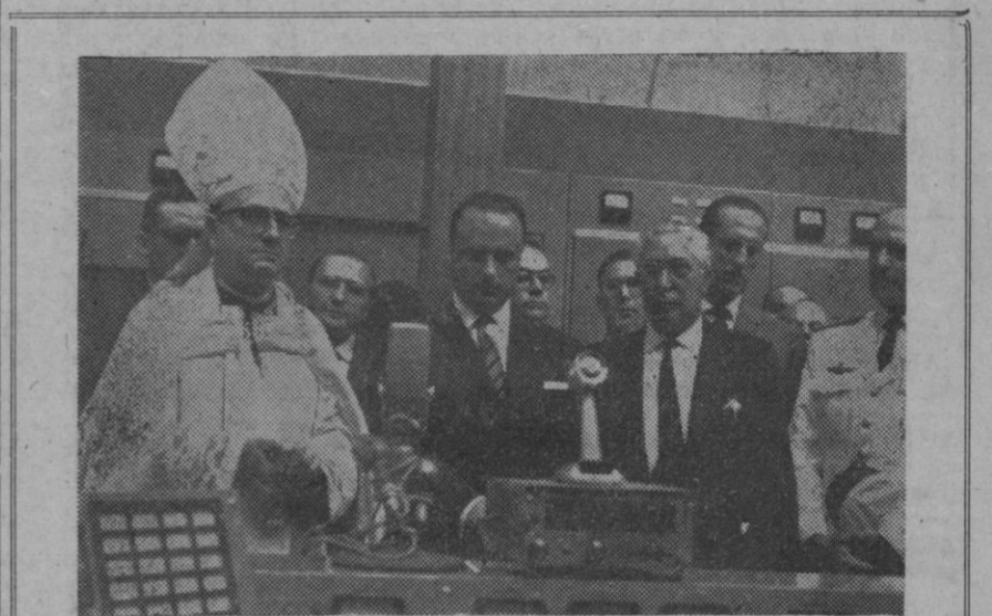
Santa Cruz de Tenerife.—Durante la estancia del ministro de Información y Turismo, señor Fraga Iribarne, en Tenerife, se inauguró el Centro emisor del Atlántico, instalado en Santa Cruz. En la foto, el señor Fraga Iribarne con el obispo auxiliar de Tenerife, en un momento de la inauguración.

Al ocupar su sitio esta mañana entre los padres conciliares, es la primera mujer, en más de 17 siglos, que asiste a tal asamblea.—Efe.