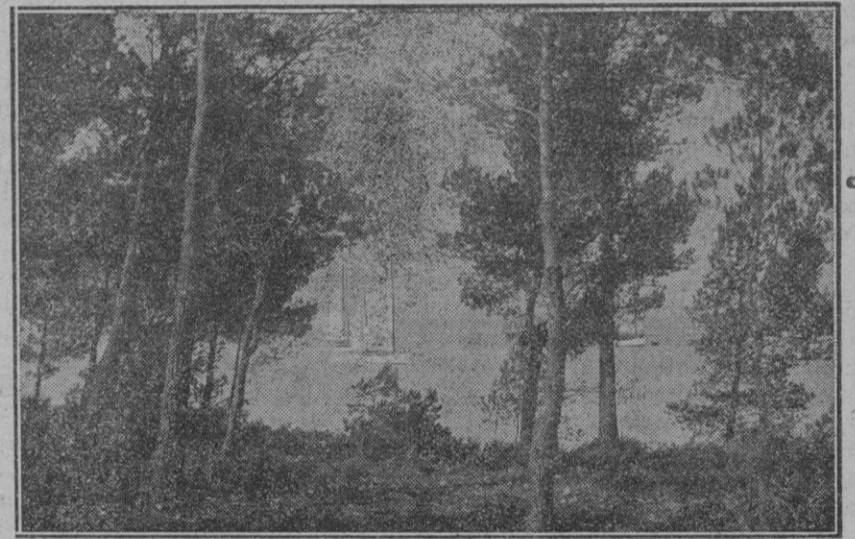
Yates en la bahía de Pollensa.

olor de bàsem, ombra serena, remor suau... Oh dolç estatge de bellesa i pau.