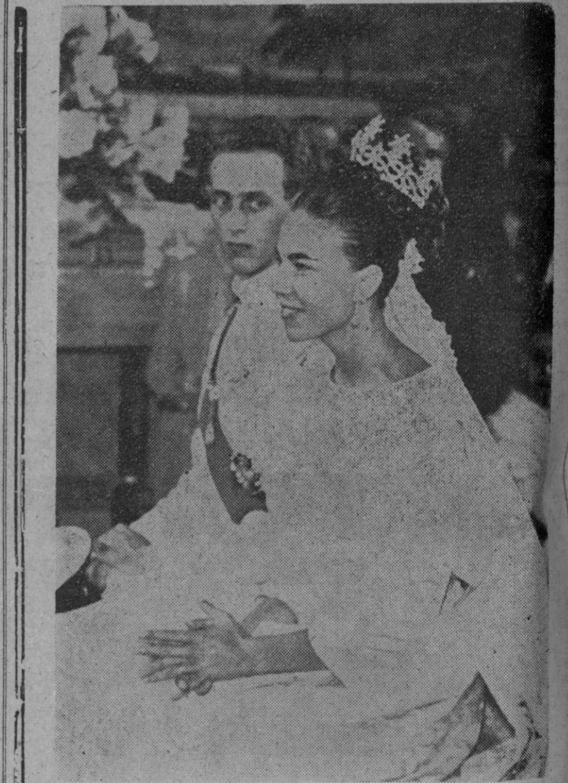
Cintra.—En la iglesia de San Pedro de Cintra, el 22 de julio, a las nueve de la mañana, han contraído matrimonio los príncipes Claudia de Orleans, de 21 años, hija de los condes de París, y Amadeo de Aosta, sobrino del Rey Humberto de Italia, también de 21 años. Por parte de él fueron apadrinados por los príncipes Juan Carlos y Sofía, y por parte de ella, por el príncipe Enrique de Clermont y su esposa. El príncipe vestía uniforme de oficial de la Marina de guerra italiana y ella un vestido de brocado natural. En la foto, un momento de la ceremonia.

Unicamente dos cadáveres han sido recuperados hasta ahora de los 30 marineros desaparecidos.