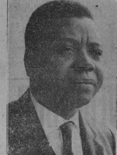
Moisés Tshombé, antiguo presidente de Katanga, nombrado primer ministro y ministro de Asuntos Exteriores del Congo

San Sebastián, 24.—Sus Majestades los Reyes de Bélgica han llegado a aeropuerto de Fuenterrabía, en avión militar y siguiendo viaje a Zarauz.