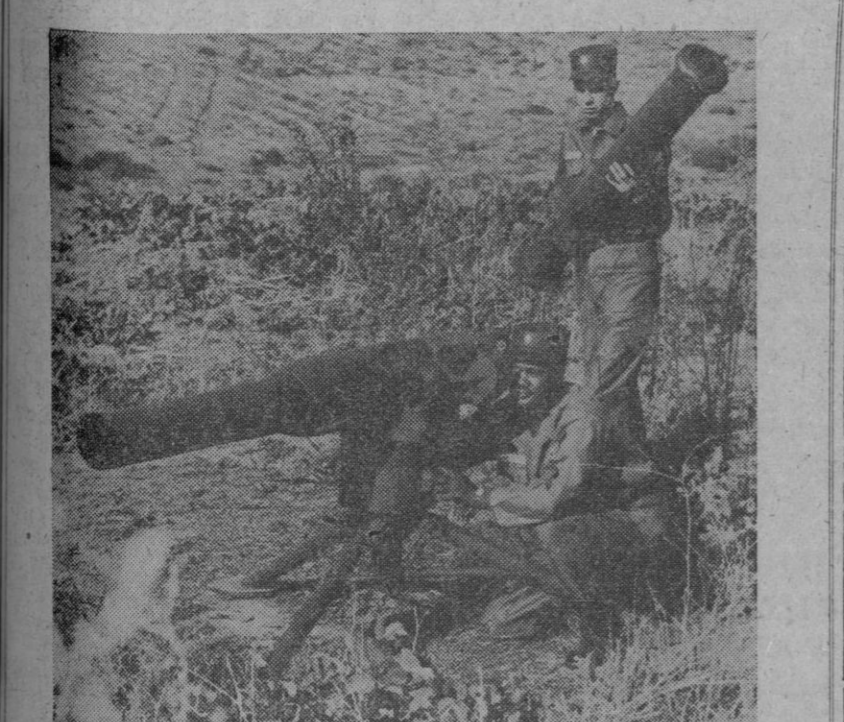
El Ejército de los Estados Unidos está ensayando un cohete antitanque guiado al objetivo por unos alambres capilares colgantes. Esta arma dará a los futuros infantes una mayor potencialidad de fuego debido a su alta precisión. El peso total del dispositivo lanzador y del sistema electrónico no llega a los setenta y cinco kilos

Mengele, fue detenido en una hacienda de la jungla, a 960 kilómetros de Lima. Fuentes bien informadas indican que trabajaba en una floreciente explotación agrícola, en Tambo, cuando fue detenido por la policía peruana.—Efe.