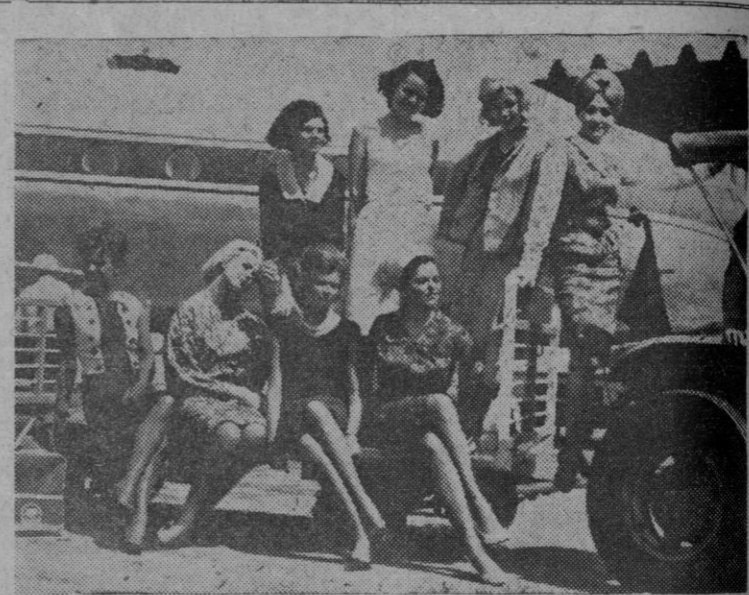
Algunas de las bellezas que han participado en la elección de "Miss Europa 1964", en un momento en el aeropuerto romano de Fiumicino, en tránsito hacia Beirut, la capital donde tuvo lugar la elección.

El "Titan-3", producto de la más poderosa arma de guerra de los Estados Unidos, proporcionará fuerza para el formidable lanzamiento de proyectiles.