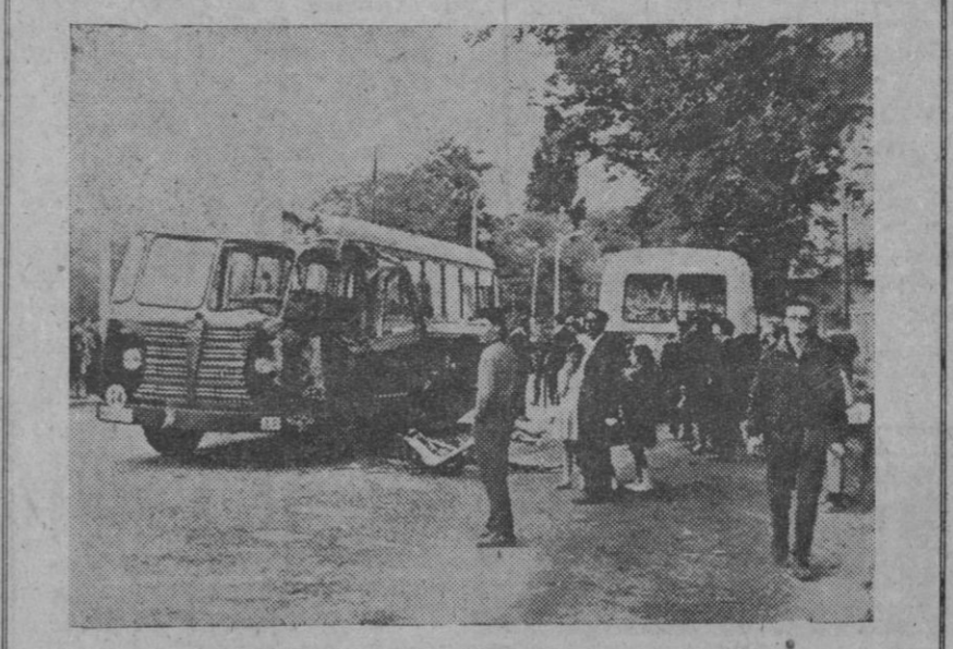
En la carretera de la estación del Norte de Pamplona, a la altura del monasterio de las Oblatas, chocaron dos autobuses del servicio urbano, al pretender adelantarse uno de ellos a un camión que rodaba delante. En el accidente, dos jóvenes de diecinueve años perdieron la vida, resultando además veinticinco personas heridas, por fortuna leves. En la foto, los dos autobuses después del accidente.