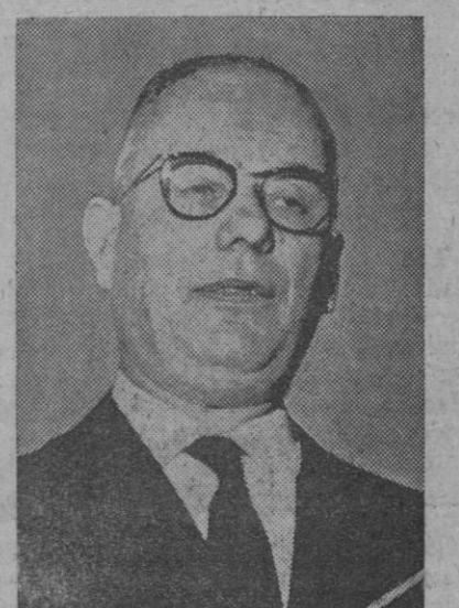
Waldeck-Rochet, quien ha sucedido a Maurice Thorez en el puesto de secretario general del partido comunista francés