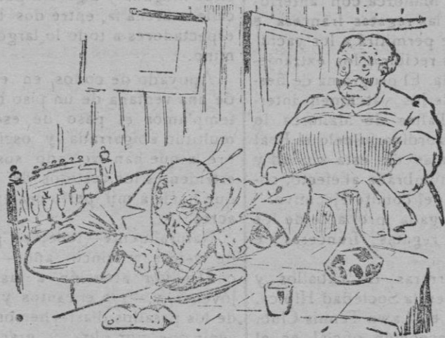
EN LA CASA DE HUESPEDES

—¿Quién te quiere a ti cachito de... vacal!