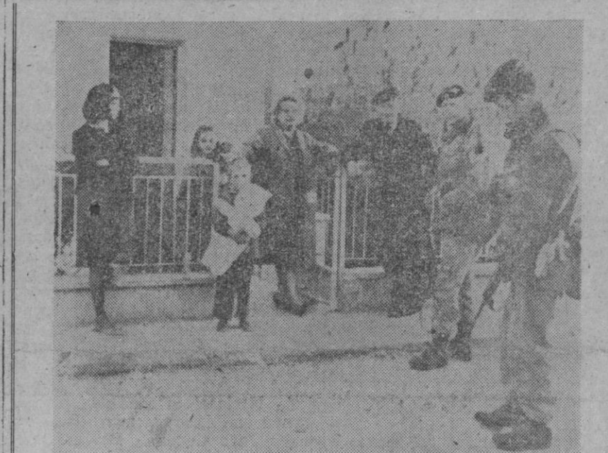
Nicosia.—La situación en la isla de Chipre se ha ido haciendo más y más explosiva. El peligro de una guerra civil se ha acentuado del ambiente. Ante la posibilidad de que estalle un conflicto, los familiares de las tropas británicas estacionadas en Chipre han iniciado la evacuación de la isla. En la foto: protegidos por paracaidistas británicos, una familia abandona el que hasta ahora ha sido su hogar.

Zaragoza, 20.—La empresa del cine «Palafox», el mejor de Zaragoza, en el que se estrenó el pasado lunes la película «Nuevas amistades», además de anunciar para mañana cambio de programa, publica hoy en la prensa local un recuadro con la siguiente nota: «La empresa del cine «Palafox» comunica a sus habituales espectadores que, por compromisos ineludibles de programación, se ha visto obligado a proyectar la película actualmente en cartel, pero dada la calidad inmaterial y desagradable de su tema, la empresa se considera en la obligación de hacerlo saber al público para que este obtenga en consecuencia».