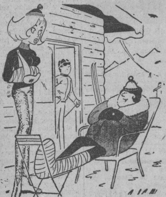
—Yo soy tan prevenida que ya vengo a espiar con la pierna rota. Así me evito romperme las dos.