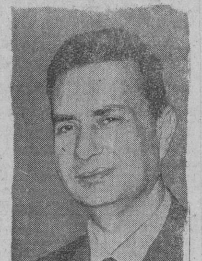
Aldo Moro, secretario del partido demócrata cristiano que, posiblemente, va a ser llamado a formar Gobierno en Italia

Se informa, por otra parte, que fue a instancias de la reina, después de la cena celebrada en la Embajada francesa, cuando el rey consintió en llamar a su médico. Los síntomas parecían que no eran muy claros y el soberano no quería despertar a al doctor. Sin embargo, éste acudió y dijo que se imponía una operación urgente e hizo llevar inmediatamente al rey al hospital Evangelismos, donde el rey fue intervenido poco después.