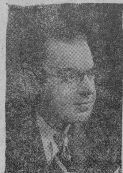
Paul Martin, nuevo ministro canadiense de Asuntos Exteriores

También se examinaron asuntos relacionados con la recaudación de cuotas y procedimiento de apremio.—Cifra.