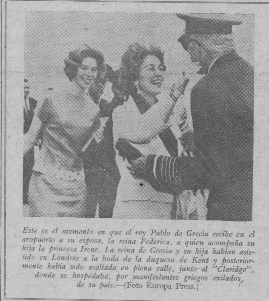
Este es el momento en que el rey Pablo de Grecia recibe en el aeropuerto a su esposa, la reina Federica, a quien acompaña su hija la princesa Irene. La reina de Grecia y su hija habían asistido en Londres a la boda de la duquesa de Kent y posteriormente había sido asaltada en plena calle, junto a "Claridge", donde se hospedaba, por manifestantes griegos exiliados de su país.

Madrid, 7.—Han continuado las tareas del XVII Congreso de la Federación Internacional de Asociaciones Turísticas Ferroviarias, reuniéndose las distintas comisiones de trabajo que la componen en las que se tomaron importantes acuerdos.—Cifra.