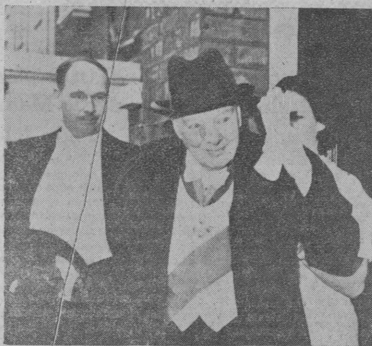
Winston Churchill saluda a las personas que le aguardaban a la salida de su domicilio cuando salía para el banquete anual de la Real Academia, al que asiste ininterrumpidamente desde que acabó la guerra. El viejo político, que ha cumplido los ochenta años, ha anunciado su retirada del Parlamento en las próximas elecciones, del que es miembro desde 1900. Ha manifestado que el accidente que sufrió el pasado año en Montecarlo, en el que se rompió una pierna, le ha restado movilidad y le impide asistir a la Casa de los Comunes.

Se ha sabido, mientras tanto, que quince personas que buscaron refugio en la Embajada brasileña y cinco «invitados» del embajador español, obtuvieron permiso para abandonar el país. El Ministerio de Asuntos Exteriores no les concedió escolta hasta el aeropuerto y su única protección la constituían las banderas que ondeaban en sus automóviles. Otras Embajadas hispanoamericanas facilitaron vehículos para que formasen parte del cortejo, a modo de escolta entre la ciudad y el aeropuerto.