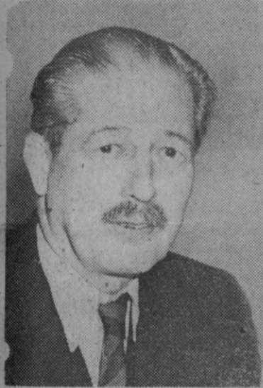
Harold Mac Millan, primer ministro inglés, que ha celebrado conversaciones con De Gaulle, y que proyecta reunirse también con Kennedy, los días 19 y 20 de los próximos días en las islas Bahamas.

Londres, 17.—El jefe del Gobierno, Harold MacMillan, se trasladará hoy a Las Bahamas, donde él y el presidente Kennedy, durante una entrevista de "alto nivel", que durará dos días intentarán obtener una solución para la aguda controversia anglo-norteamericana en torno al proyectil "Skybolt".