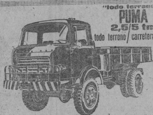
Para explotaciones forestales, minería, obras públicas, agricultura...