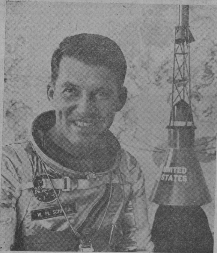
El astronauta norteamericano Walter M. Schirra

Cabo Cañaveral, 19.—El astronauta Walter M. Schirra, Junior, ha sido designado para llevar a cabo el próximo experimento orbital tripulado. Ha bautizado a su cápsula con el nombre de «Sigma-7». «Sigma» es la 18 letra del alfabeto griego y coincide con la inicial del apellido del astronauta. El siete se refiere al número de los astronautas del Proyecto Mercury, de los cuales él es uno.