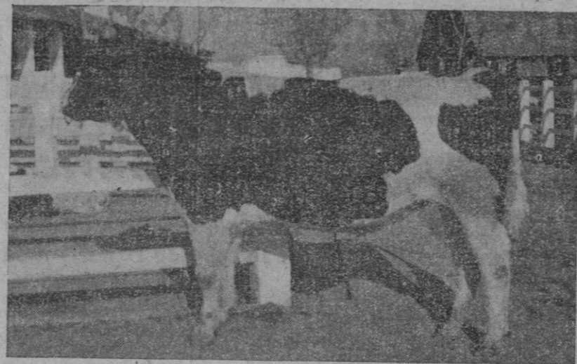
PRIÉGOLA DUPLEXLIM. El toro elegido para mejorar el ganado lechero de nuestra provincia. Revine en su pedigree campeones de raza y productoras de alto nivel