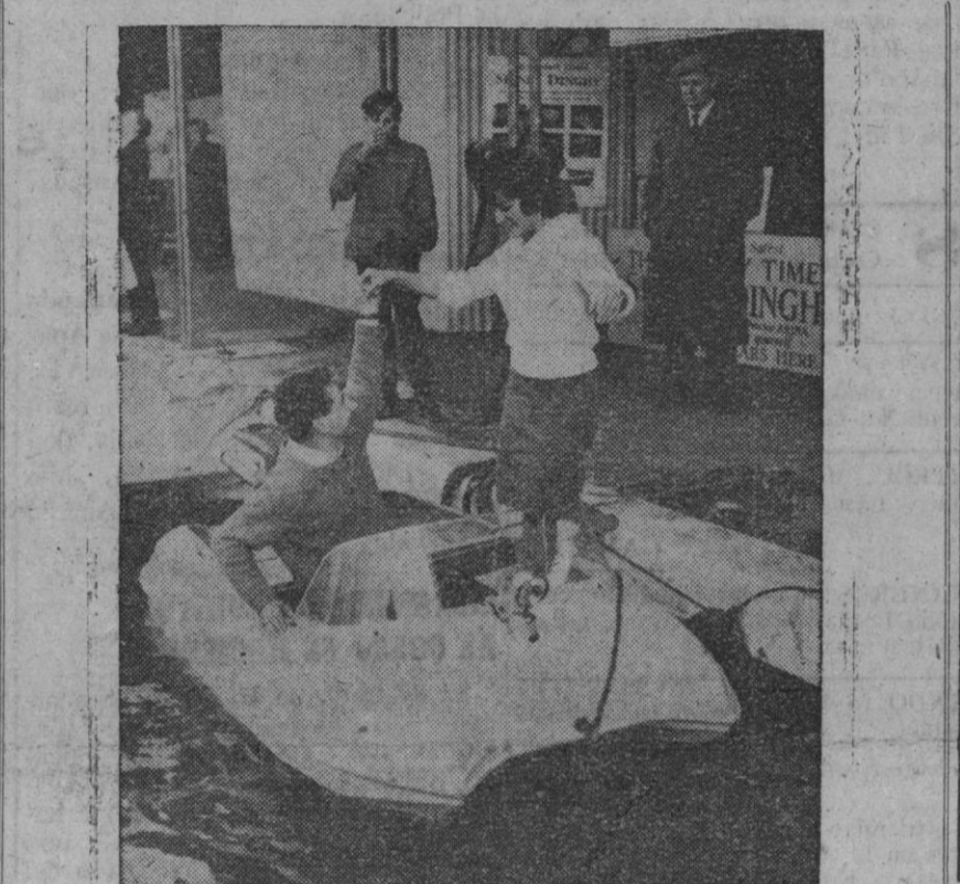
Una atractiva visitante a la reciente exposición de embarcaciones menores, celebrada en el Canal Grand Unión (la pequeña Venecia), de Londres, acepta una galante invitación a inspeccionar el nuevo catamarán, que puede usarse como velero familiar o para cruceros de río, provisto de motor fuera borda, de 10 c. f. Fácilmente portable en el techo de un automóvil, el "encal" es rápido y maniobrable, pudiendo cabogar en poco más de su propia eslora; 2,48 metros. Su manga es de 1,35 metros, y su peso, cuarenta kilogramos.

«Al solicitar ayuda de Occidente, el régimen alemán oriental tiene que "tragarse" todas las declaraciones de Walter Ulbricht, jefe del Gobierno comunista, en torno a la rapidez con que la Alemania comunista podría compararse, económicamente, a la Alemania occidental», termina diciendo el periódico.—Efe.