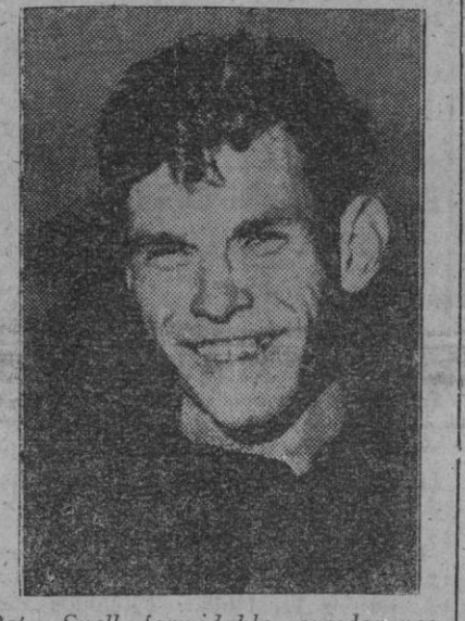
Peter Snell, formidable corredor neozelandés que, en una semana, ha logrado nuevos récords mundiales sobre 800 metros, 880 yardas y una milla inglesa

El régimen de ayuda a la familia aplicable a la mujer se atenderá a lo dispuesto en las normas que regulan dicha institución de la seguridad social, en equiparación de derechos y obligaciones con el trabajador varón. El Ministerio de Trabajo dictará o propondrá al Gobierno, en su caso, las disposiciones necesarias para el desarrollo de este decreto del Ministerio de Trabajo que hoy publica el «Boletín Oficial del Estado».—Cifra.