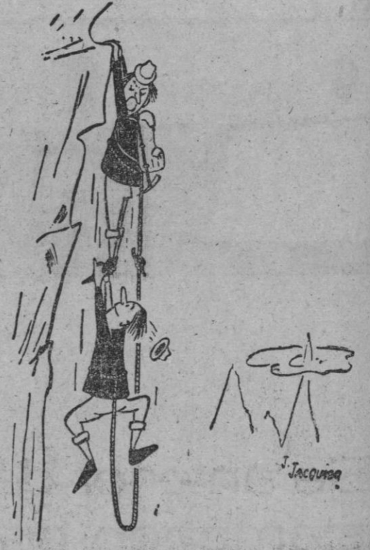
—Si sigues haciéndome cosquillas en los pies, me suelto...

Haga usted ERKA las prendas de punto misma con ERKA de toda su familia. Infórmese mañana mismo CASA SOLERA