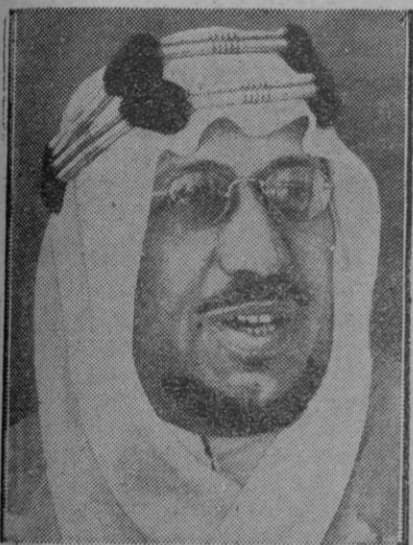
Ibn Saud, rey de la Arabia Saudita

El Jefe del Estado español se hallaba en el aeropuerto desde la una menos cuarto de la tarde, adonde llegó acompañado por los jefes de las Casas Civil y Militar, conde de Casa Loja y teniente general Asensio, respectivamente, y segundos jefes, señor Fuentes de Villavicencio y general Laviña.