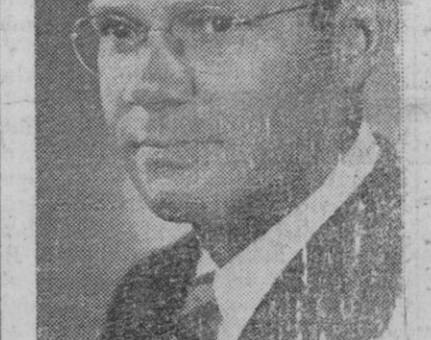
Robert S. McNamara, ministro de Defensa en el nuevo Gobierno de Kennedy en Estados Unidos

Pero, al parecer, el oficial norteamericano ha desmentido un informe anterior según el cual Galvao estaba dispuesto a devolver el mando del buque a su verdadero capitán.—Efe.