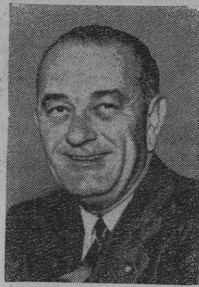
Lyndon Johnson, vicepresidente electo de los Estados Unidos, que dirige la delegación norteamericana en la Conferencia parlamentaria de la O. T. A. N. en París

Después de visitar detenidamente el nuevo destructor español, el ministro de Marina obsequió a los asistentes con una copa de vino español a bordo del minador «Júpiter» también fondeado en el muelle.—Cifra.