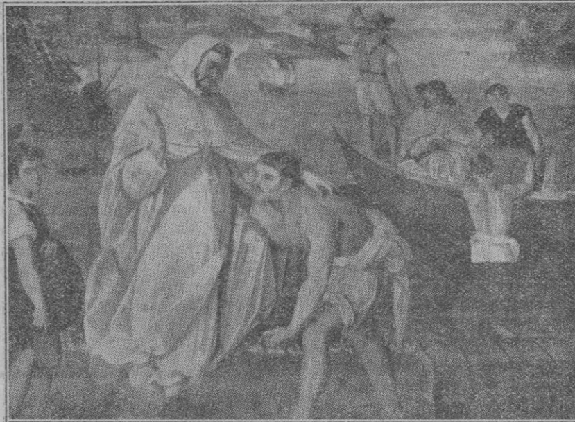
San Pedro Nolasco embarcándose para redimir cautivos, cuadro de Pacheco (Museo de pinturas de Sevilla).

La dará hoy jueves a las siete de la noche el comandante de Artillería don Miguel Ribas de Pina, sobre el tema «Estudio militar del sitio de Palma por Jaime el Conquistador».