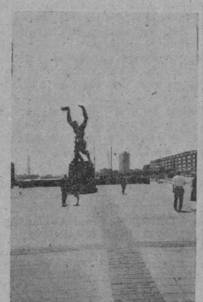
«La ciudad sin corazón», bronce de Zackhine, junto al puerto de Rotterdam

Visité Rotterdam, a principios de junio de este año, con motivo de la Exposición de flores—«La Floriade»—inaugurada a la sazón en los dilatados terrenos del parque de Rotterdam y otros aledaños, que se prolonga hasta