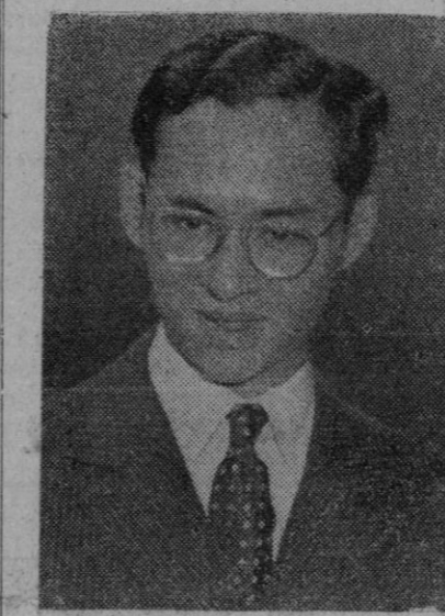
El rey Bhumiphon Adunet y la reina Sirikit, la joven pareja real de Tailandia, en gira por los países europeos