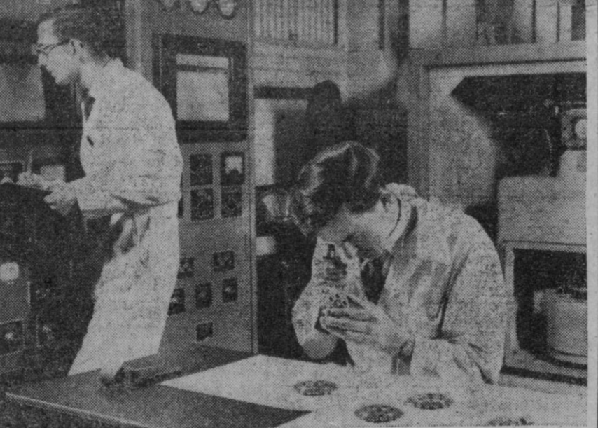
Un técnico del centro de investigaciones de una compañía petrolera británica examina las ruedas dentadas después del funcionamiento de prueba de una máquina de engranajes (que se ve a la derecha) empleada para probar lubricantes de cajas de velocidad en condiciones de operación. En la izquierda se ve el panel de control donde se registra la temperatura del aceite. Este es uno de los muchos preparativos para la tentación que realizará Donald Campbell en septiembre, con objeto de batir en su nuevo Bluebird, el récord mundial de velocidad por tierra. Campbell correrá en Bonneville Salt Flats, Utah, Estados Unidos

Liverpool (Inglaterra), 9.—El «Bluebird» (Pájaro Azul) dotado de un motor a reacción, en el cual Donald Campbell espera batir el récord mundial de velocidad, establecido por John Cobb, ha salido para los Estados Unidos, a bordo del buque de carga norteamericano «American Veteran», que tiene su llegada a Boston el próximo día 16.—Alfil.