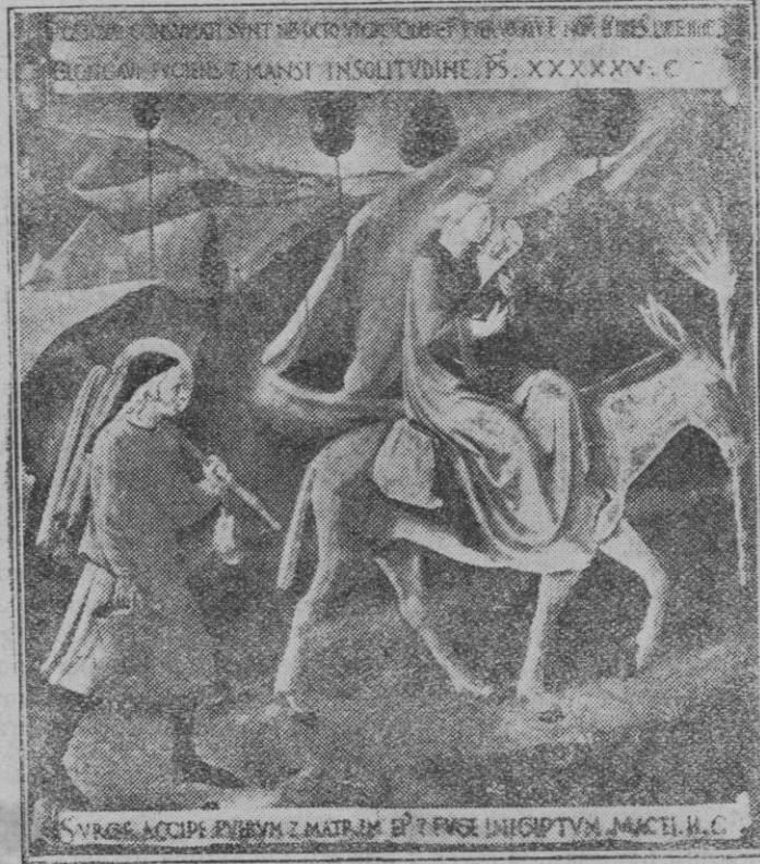
La huida a Egipto, pintura de Fray Angélico (Academia, Florencia)

Con las diligencias del caso, dicho individuo fué puesto a disposición del Juzgado de Instrucción del Distrito de la Lonja