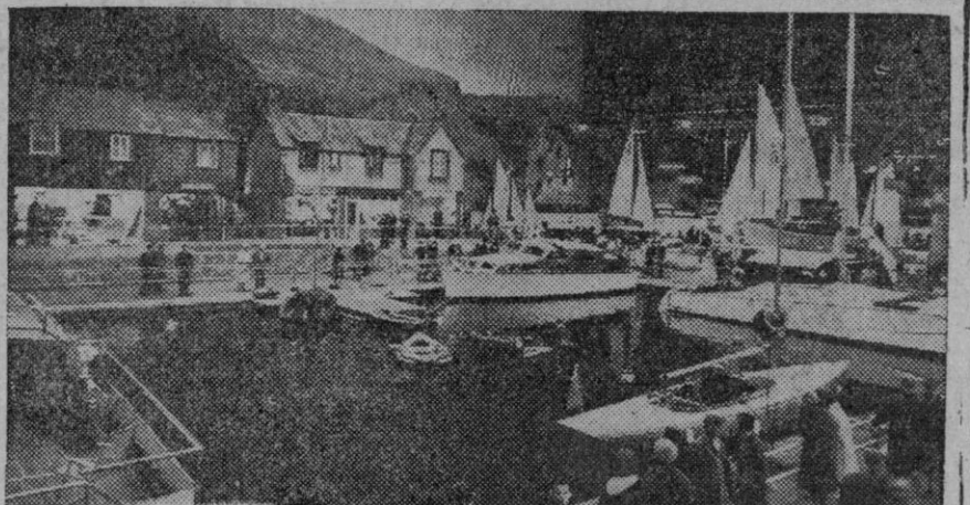
Una aldea marítima situada en el corazón de Londres, con sus tiendas, casitas y yates de todas clases. Esta aldea artificial es la atracción central de la Sexta Exposición Nacional de Embarcaciones Menores, celebrada recientemente en Londres. Concurren a ella unos 350 expositores que muestran todo género de embarcaciones