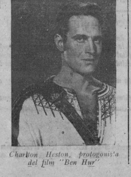
Charlton Heston, protagonista del film "Ben Hur"

para que las proyecciones sigan durante 3 años consecutivos, lo que representará más de dos mil proyecciones con un total de cuatro millones de espectadores. El libro «Ben Hur» se publicó en 1880; pero su historia como espectáculo data de 1890. Durante varios años su autor se negó rotundamente a que la obra fuera llevada a las tablas; pero finalmente la empresa teatral Klaw & Erlanger, de Nueva York, convenció a Lew Wallace que la autorizara a utilizar el libro para llevarlo a las tablas. Como compensación le ofrecieron el 4 tres cuartos por ciento de los beneficios, lo cual era un porcentaje muy elevado en aquellos días y se calificó como el negocio de un millón de dólares, aunque se supone que lo superó. La palabra «millones» se ha hecho inseparable de «Ben Hur». En 1913 volvía a sonar este nombre. Un editor americano publicó una nueva edición del libro a treinta y seis centavos ejemplar y vendió millones. El éxito repercutió en otros países, se tradujo la obra en infinitad de idiomas y todos los editores ganaron millones. Durante dicho año 1913 «Ben Hur» fue la novela que más se vendió en todo el mundo. Ahora, en 1959, ante el solo anuncio de que está terminada la nueva versión cinematográfica de «Ben Hur», de todas las imprentas del mundo, en todos los idiomas, salen de nuevo los libros de «Ben Hur».