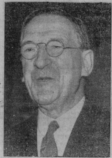
Eamon de Valera, patriarca de Irlanda, que a la edad de setenta y siete años ha obtenido el puesto honorífico de presidente del país.

El "Saturno" tendrá unos setenta metros de altura y pesará alrededor de las quinientas ochenta toneladas. El primer lanzamiento del nuevo cohete ha sido anunciado para fines de 1960.