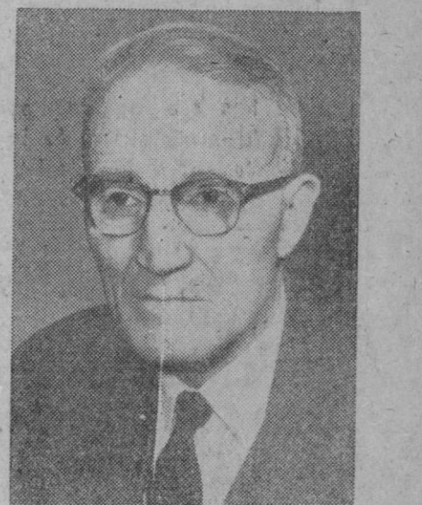
Howard C. Green, hasta ahora ministro de Obras Públicas de Canadá, que ha sido nombrado para el mismo cargo de Negocios Extranjeros

Las resoluciones dictadas en los expedientes administrativos respectivos por las Delegaciones provinciales y funcionarios delegados de la Comisión de Compra y por ésta, serán recurribles en la forma prevista en la ley de procedimiento administrativo.—Cifra.