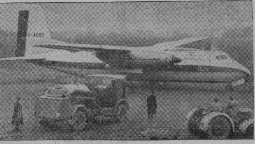
El segundo-prototipo del avión de pasajeros «Dart Herald» realizó recientemente su primer vuelo desde un pequeño aeródromo de césped ubicado en Reading, Inglaterra. El primer prototipo finalizó sus vuelos de prueba—más de doscientas horas de permanencia en el aire—antes de que fuera destruído en un incendio. Este avión puede transportar cuarenta y siete pasajeros, 4,5 toneladas de carga, o una combinación de ambos, a una velocidad crucero de 456 k. p. h. Con una carga máxima superior a 4.500 kilogramos, su autonomía es superior a 1.050 kilómetros, pero si se le reduce dicha carga a 2.790 kilogramos puede volar sin etapas una distancia de 2.288 kilómetros

Palma de Mallorca, 14.—Se ha efectuado la botadura del buque frutero «Cala Nova», de 1.056 toneladas, el segundo de una serie de seis que se han de construir en los astilleros Palma en el plazo de tres años. El primero de ellos, el «Cala Blanca» fue botado ya en Septiembre del pasado año y para dentro de este mismo año se espera sean botados otros dos de la serie. Estos buques son los primeros, con casco de acero y los de mayor tonelaje construídos en factorías navales mallorquinas. Con este motivo, ha vuelto a funcionar el magnífico puente giratorio construído en el paseo marítimo y que permite la realización de estas operaciones sin que el tránsito quede interrumpido más que en el momento preciso de efectuar la botadura. A la ceremonia asistieron las autoridades y numerosísimo público.