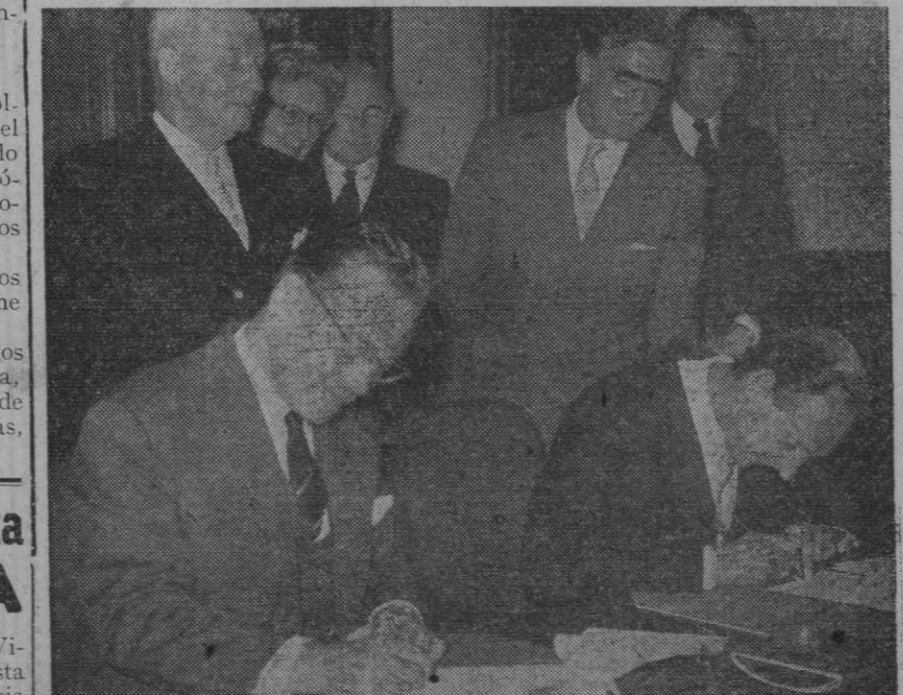
En el décimo aniversario del acuerdo anglo-norteamericano Fulbright, el embajador de Estados Unidos en Gran Bretaña, señor John Hay Whitney (izquierda) y el señor D. Ormsby-Gore, ministro británico de Estado para Relaciones Exteriores (derecha), firman el instrumento de renovación del acuerdo por otros diez años. El acto tuvo lugar recientemente en Londres. El acuerdo Fulbright, tiene por principal objeto el ingreso de unos ciento cincuenta estudiantes norteamericanos por año en universidades británicas