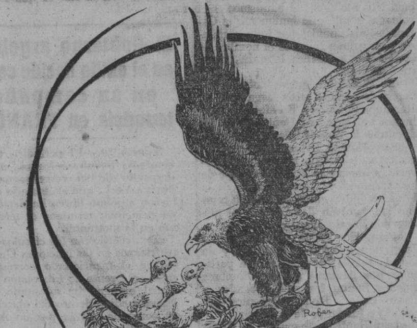
...el águila prefiere las peñas inaccesibles.