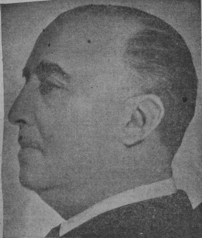
Su Excelencia el Jefe del Estado