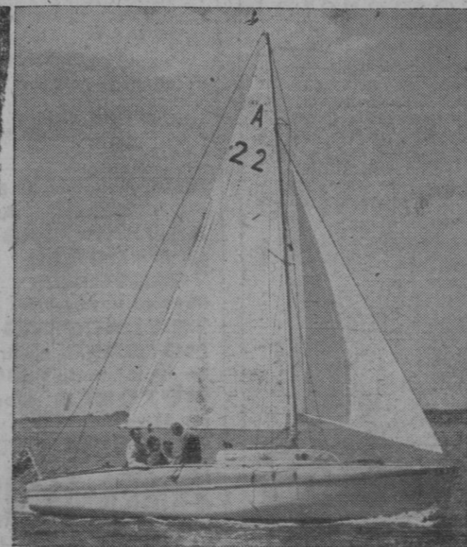
El velero inglés "Atlántida", expuesto en la Exposición Internacional de Bruselas, cuyo diseño se ha hecho popularísimo entre los entusiastas del deporte de la vela, como se advierte por la gran demanda de pedidos a la casa constructora, procedentes de los Estados Unidos, Canadá, Holanda y otros países.