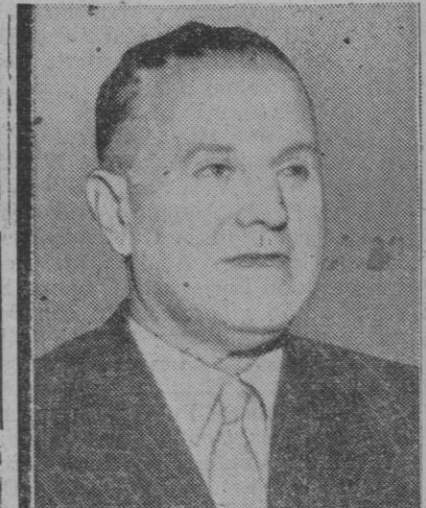
Abdel Jalek Hassuna, secretario general de la Liga Árabe, quien ha declarado que Túnez y Marruecos ingresarán en la Liga

Méjico, 21.—Continuó el violento temporal de lluvias que ha causado la muerte de 23 personas y ha originado grandes pérdidas a consecuencia de las inundaciones.—Efe.