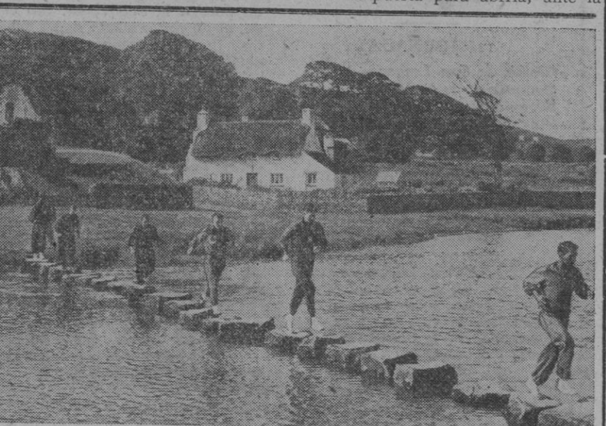
Corredores del Maratón de los países de la Commonwealth participantes en los Sextos Juegos de la Commonwealth y el Imperio Británico, atravesando el río Ognore, durante un ejercicio de entrenamiento. Al fondo se ve una casa típica de Gales con techo de bálago

Mientras se realizaba el audaz atraco, uno de ellos mantenía, valiéndose de un fusil ametrallador, con los brazos en alto a los viandantes. Terminada la «operación», los cuatro enmascarados subieron al Sedan y desaparecieron a toda velocidad.—Efe.