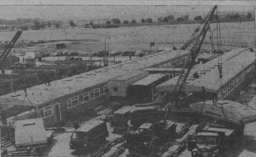
En el aeropuerto de Londres se construyó recientemente en doce horas un edificio para oficinas, que ocupa una superficie de 1.026 m 2 . El edificio quedó completamente terminado, con decorado, instalaciones de agua y alumbrado y listo para ser ocupado. Sirve de alojamiento a cien técnicos de la British European Airways. En la construcción se emplearon cincuenta y siete unidades preparadas de antemano, una de las cuales se ve en esta fotografía en el momento en que una grúa móvil la coloca en posición. Cada unidad pesaba 3,5 toneladas y estaba compuesta de piso, techo y tejado en una pieza y paredes plegables. En la erección trabajaron dieciséis hombres, terminando la obra dos horas antes del plazo fijado.