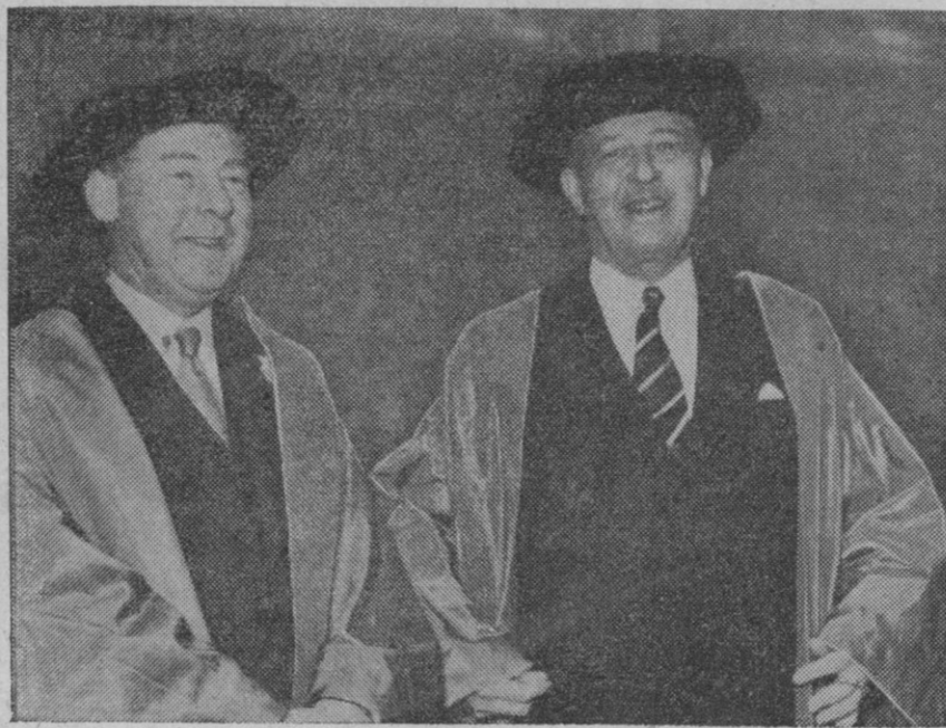
El primer ministro de Gran Bretaña, Mac Millan y el jefe de la oposición, Gaitskell, recibieron recientemente juntos sendos títulos honorarios de doctor en Derecho Civil en la Universidad de Oxford. Ambos cursaron sus estudios, con diplomas de primera clase, en dicha Universidad. El señor Mac Millan se graduó en 1919, en el Colegio Balliol, y el señor Gaitskell lo hizo en 1927, en el New College

Estos precios se entienden para el pan de flama, continuando en vigor los aumentos de 0,35, 0,20 y 0,10 pesetas para el candal y en piezas de 1.000, 500 y 250 gramos, respectivamente.