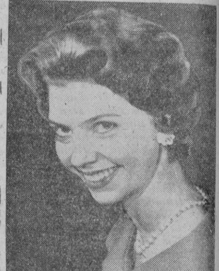
La princesa Desirée, hija del rey de Suecia, de quien se habla de futuras relaciones entre ella y el príncipe Konstantin

Trieste, 22.—El cardenal Stepinac, primado de Yugoslavia, se ha agravado en su estado de salud, según noticias recibidas de Zagreb. No se tienen más detalles porque las autoridades yugoslavas se han negado a facilitarlos y es prácticamente imposible establecer contacto con la residencia del cardenal, que se encuentra en la aldea de Krasich, cerca de Zagreb. Al parecer, el cardenal padece trombosis aguda en una pierna. Noticias más exactas recibidas en Trieste en estos días pasados daban cuenta de que se hallaba algo mejorado, hasta que esta noche sufrió una nueva crisis.—Efe.