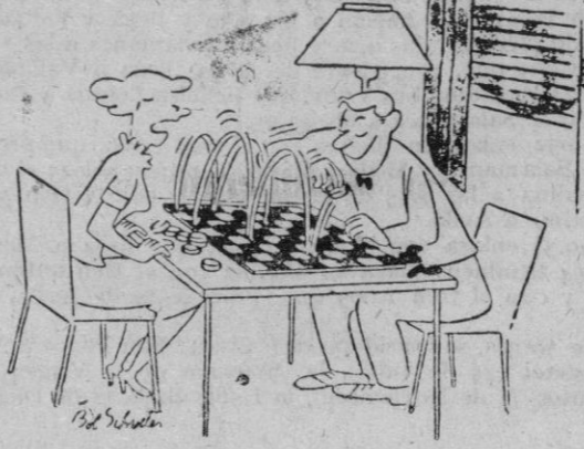
—¡Oh, Pepe! Ya no eres el mismo de cuando éramos novios...

Al cierre quedó dinero para futuras operaciones. En los demás corros hubo poco negocio.