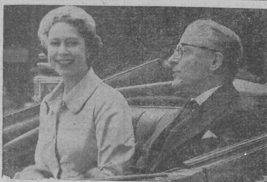
Su Majestad la Reina Isabel II y el Presidente de la República de Italia, señor Gronchi, en un momento de la visita oficial del Presidente italiano a Inglaterra. Durante la visita, el Presidente Gronchi y su esposa fueron huéspedes de Su Majestad en el Palacio de Buckingham. Esta fué la primera visita realizada en los últimos treinta y cuatro años por un Jefe de Estado italiano al Reino Unido