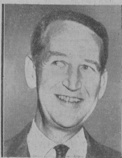
Llewellyn E. Thompson, embajador de los Estados Unidos en Moscú