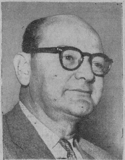
James Wadsworth, que sucede a Harold Stassen como consejero especializado del presidente Eisenhower en las cuestiones del desarme

En el plazo de setenta y dos horas será puesto en libertad o entregado a la autoridad judicial.