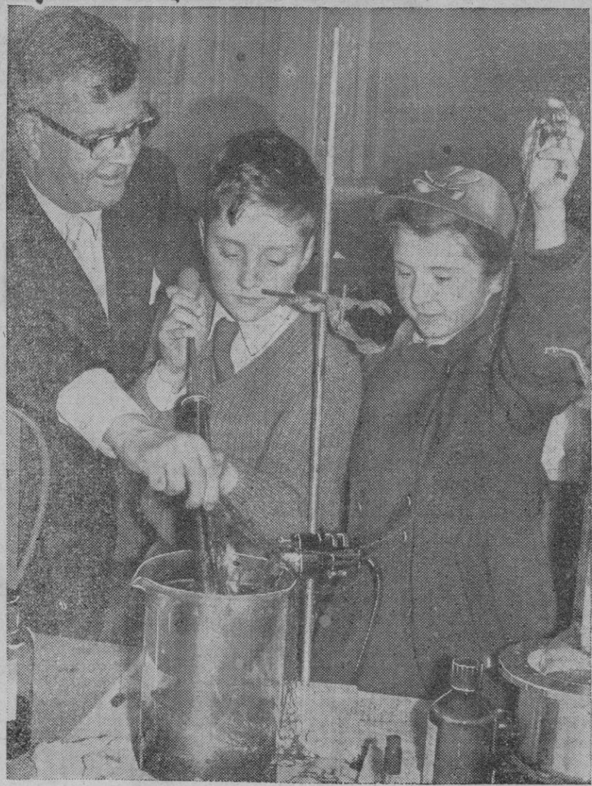
J. R. Whinfield, que fue uno de los científicos que descubrieron la fibra poliestérica británica «Terylene», pronunció recientemente, ante un auditorio infantil, una conferencia sobre el tema «Telas Suministradas por los Químicos», que puso de relieve el papel desempeñado por el químico en la producción de paños. El señor Whinfield aparece en esta fotografía con dos niños que están tratando, durante la conferencia, de llevar a cabo un experimento para obtener fibra de algas marinas

El segundo, está redactado del siguiente modo: «Diócesis Barcelona condena grave ofensa violación de derechos Iglesia recientes sucesos contra Italia reafirma dignísimo representante Santa Sede sentimientos filiales adhesión Santísimo Padre y eleva oraciones consuelo ofendidos reparación censores. Arzobispo-obispo».—Cifra.