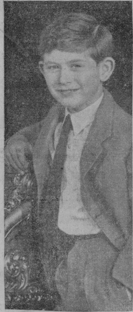
Reciente retrato de Su Alteza Real el príncipe Carlos, duque de Cornualles, que celebró no hace mucho su noveno cumpleaños

Esta aeronave está propulsada por dos turbohélices Napier Elland. Combina en su construcción algunas características de los aparatos de ala fija y de los helicópteros. Para el despegue o aterrizaje verticales, o para vuelo estacionario, se hace pasar aire comprimido de los motores a pequeñas unidades de reacción, situadas en los extremos de las alas rotoras. En estas unidades, el aire se mezcla con el combustible, y el chorro que se produce hace que las alas giren. En el vuelo horizontal, la potencia del motor se transfiere a hélices de avance.