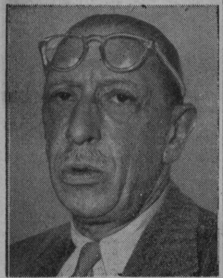
Igor Stravinsky, el famoso compositor que cumplirá el 23 de Mayo próximo 75 años de edad

Los representantes de los 40 Sindicatos envueltos en la huelga, celebrarán el martes una reunión, con el fin de decidir si dan o no orden de reanudar el trabajo mientras una Comisión investigadora del Gobierno estudia la disputa laboral. En las conversaciones celebradas la semana pasada, bajo los auspicios del ministro de Trabajo, Mac Leod, no pudo llegarse a una fórmula de acuerdo.—Efe.