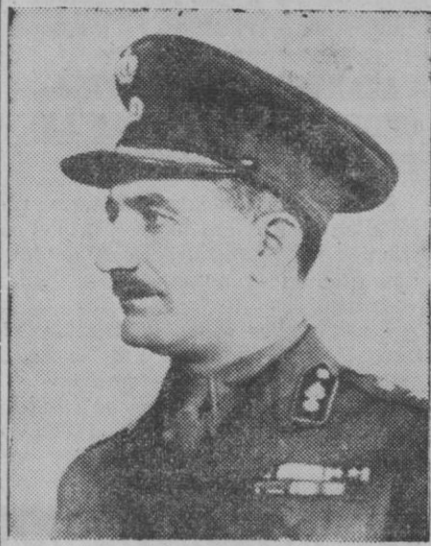
El capitán Georg Grivas (alias Digenis), jefe del movimiento griego de resistencia en Chipre

nisterio pueda prestarles en lo referente a suministro de piensos nacionales y de importación y a los aprovechamientos de pastos.—Cifra.