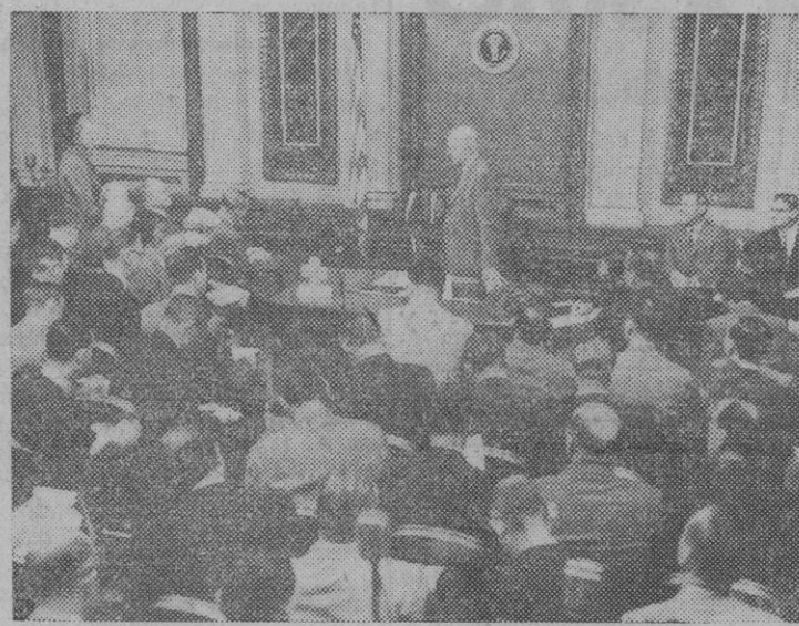
Ante la expectación mundial, centrada en torno a las conferencias de Prensa de la Casa Blanca, el Presidente Eisenhower ha anunciado recientemente su deseo de ser candidato para la reelección. Más de trescientos diez periodistas y fotógrafos abarrotaban la sala destinada a las conferencias de Prensa de la Casa Blanca, para oír manifestar a Eisenhower su tan esperada decisión.

Madrid, 6.—En el Ministerio de Asuntos Exteriores se han reunido de nuevo en la mañana de hoy las delegaciones española y marroquí continuando el estudio de la declaración conjunta y del protocolo adicional que se harán públicos con ocasión de la visita de Su Majestad Imperial el Sultán.